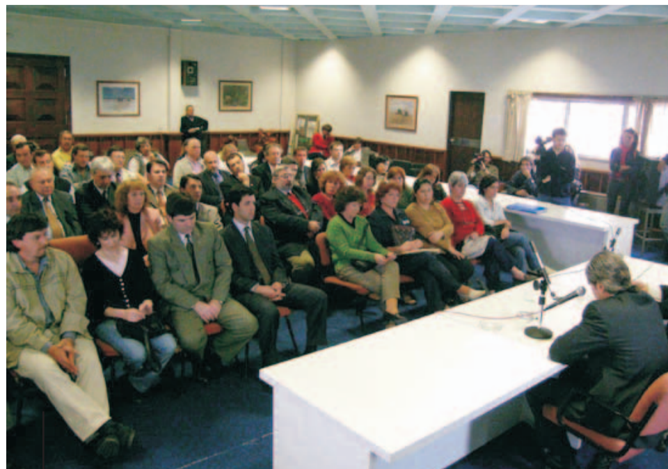
El acuerdo salarial con los no docentes fue el resultado de un proceso en el que varias veces se realizaron encuentros entre este claustro y las máximas autoridades de la UNLPam.

Uno de los acuerdos más importantes de los últimos meses fue el alcanzado entre la Universidad Nacional de La Pampa y sus trabajadores no docentes. El extenso proceso se inició en el orden nacional cuando se estableció un nuevo Convenio Colectivo de Trabajo para el sector, el N° 366/06, que ya reemplaza al N° 2213 del año 1987.