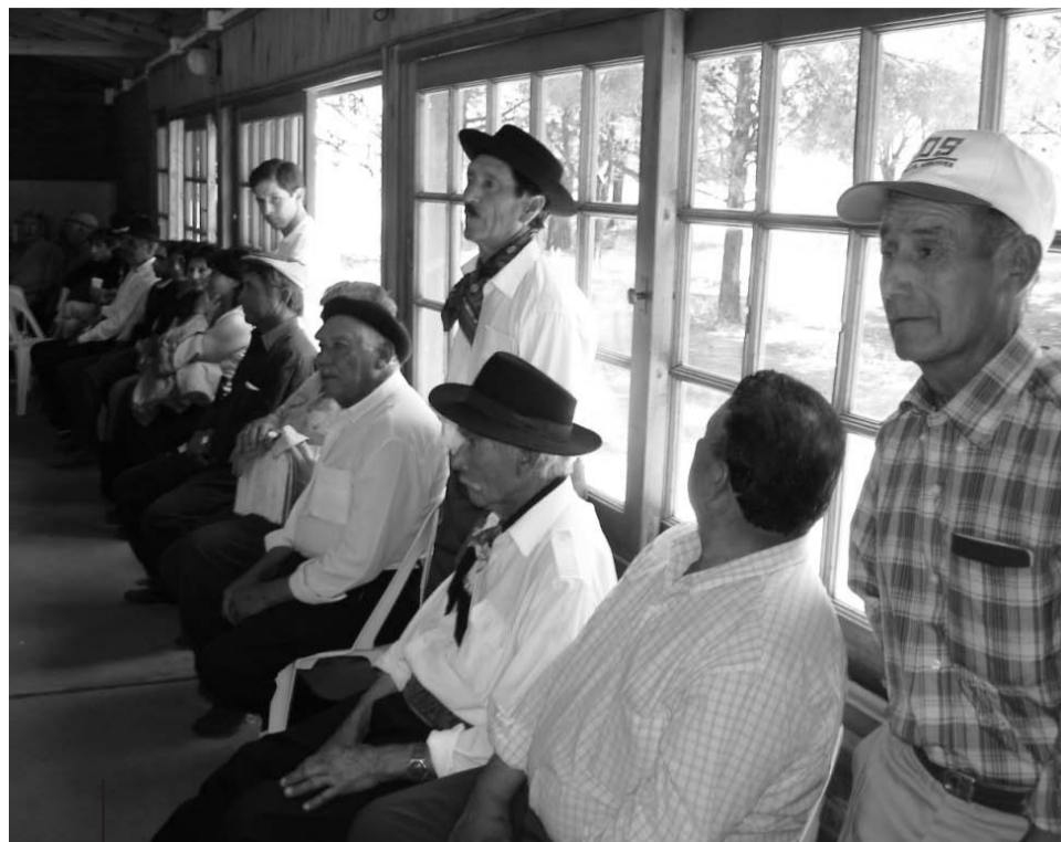
La autoorganización de los puesteros es uno de los objetivos del PEU. Las asambleas se volvieron un espacio importante para ellos.

En el oeste lejano, donde a veces pareciera que hasta Dios se ha olvidado de bendecir la tierra, los puesteros pampeanos, que por generaciones se enfrentaron al clima inhóspito y el suelo árido y rocoso, desde hace unos años ven avanzar, amenazante, la sombra de los desalojos. El año pasado un grupo de estudiantes, docentes y graduados de la UNLPam decidió que la universidad tenía que estar allí, dando una mano. Así nació el Proyecto de Extensión Universitaria (PEU) "Puesteros y Puesteras del Oeste de La Pampa: reclamos por la tierra y conflicto social".