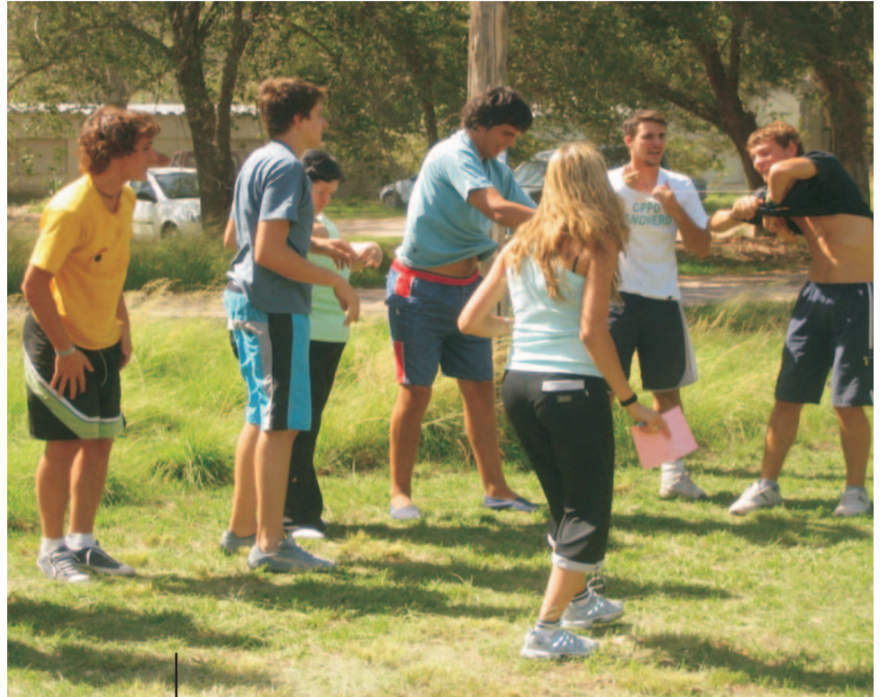
Jornada de integración organizada por la Dirección de Deportes y la Secretaría Académica de la Facultad de Agronomía con sus estudiantes ingresantes.

La población de estudiantes universitarios, por la naturaleza propia de su actividad, suele tener un alto nivel de "pasividad del cuerpo". Esto quedó reflejado en el estudio de la UNLPam, cuyas conclusiones alertan sobre la necesidad de fomentar la participación de los estudiantes en los programas desarrollados por el área de Deportes que, justamente, en 2006 fue jerarquizada y llevada al rango de Dirección. ■