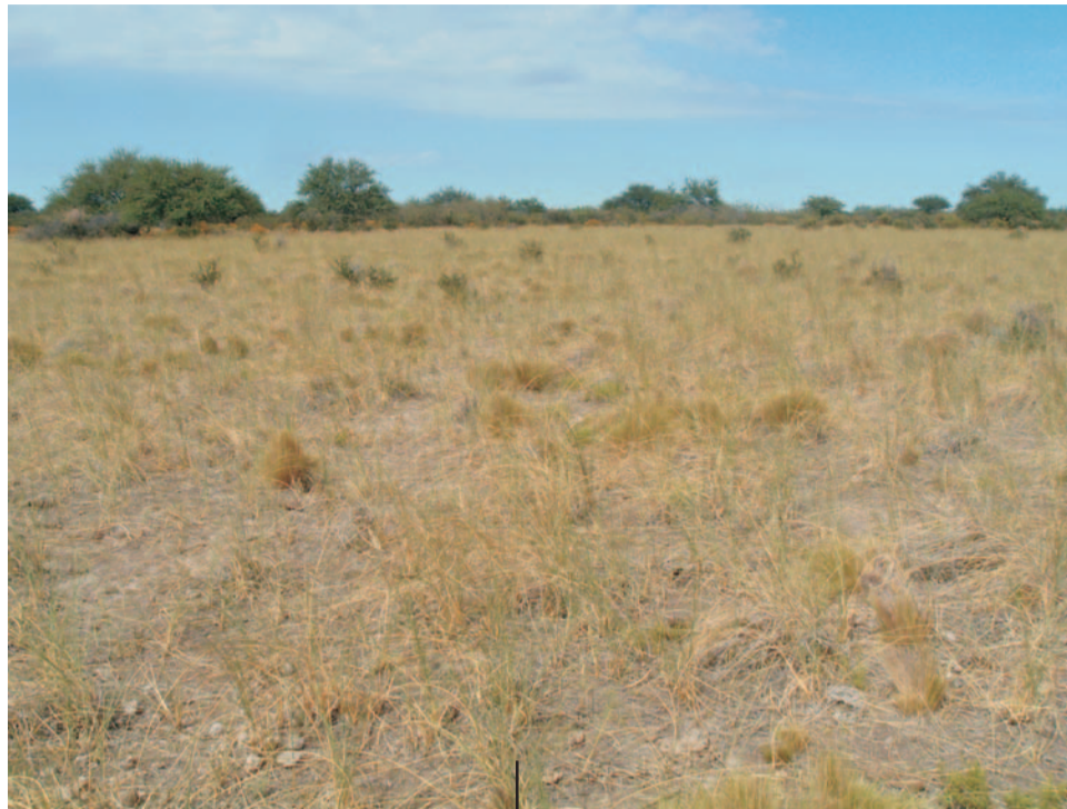
Hermosos llanos bordeados de caldenes, también conforman el paisaje.

En el año 2004 la Universidad Nacional de La Pampa creó, en sintonía con su decisión de ofrecer cada vez más herramientas de excelencia y accesibles a la sociedad, una consultora propia, un espacio institucional desde el que se brindan servicios de asesoramiento, asistencia técnica, capacitación y auditoría, entre otros. Uno de los desafíos más importantes para este órgano es el denominado Plan Estratégico de Desarrollo Productivo Sustentable del Bajo de los Baguales que desarrolló y puso en práctica a pedido de la Secretaría de Recursos Hídricos de la provincia de La Pampa, con financiamiento del Consejo Federal de Inversiones (CFI).