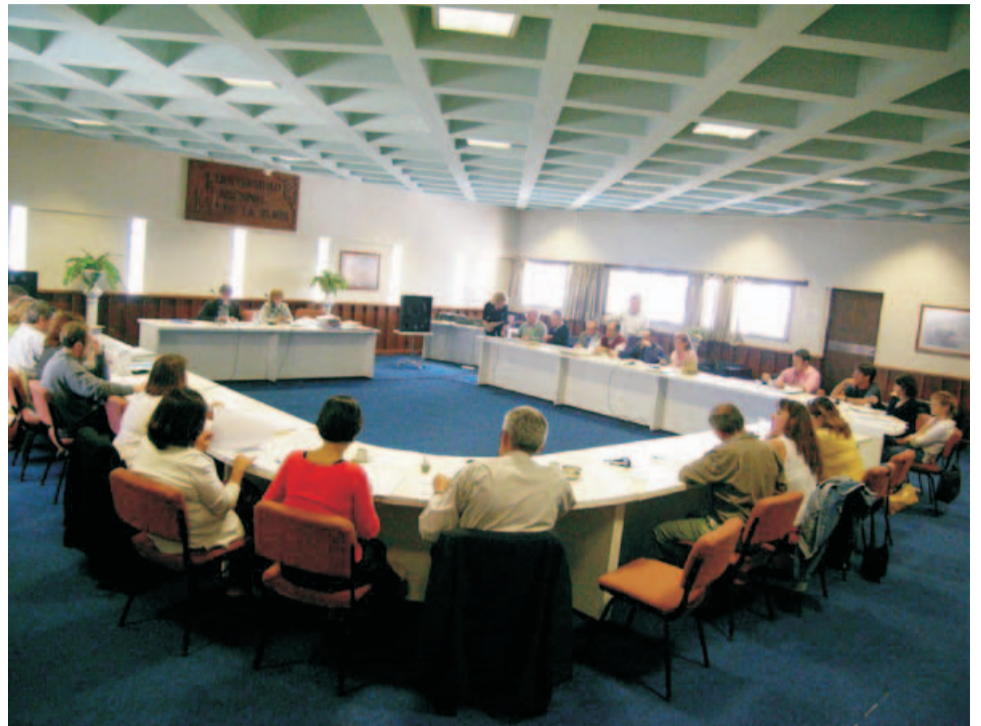
El informe de resultados de la evaluación interna fue aprobado en 2004 por el Consejo Superior.

No faltaron en la exposición de la UNLPam algunos cuestionamientos y demandas para que el proceso de